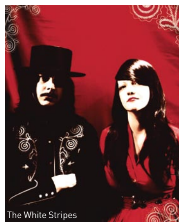
The White Stripes