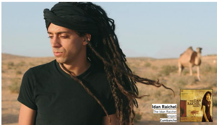
Idan Raichel The Idan Raichel project Cumbancha

UN ACERCAMIENTO A MÚSICAS DE OTROS PAÍSES A TRAVÉS DEL NUEVO SELLO CUMBANCHA. IDAN RAICHEL Y ANDY PALACIO, DOS REFERENCIAS.